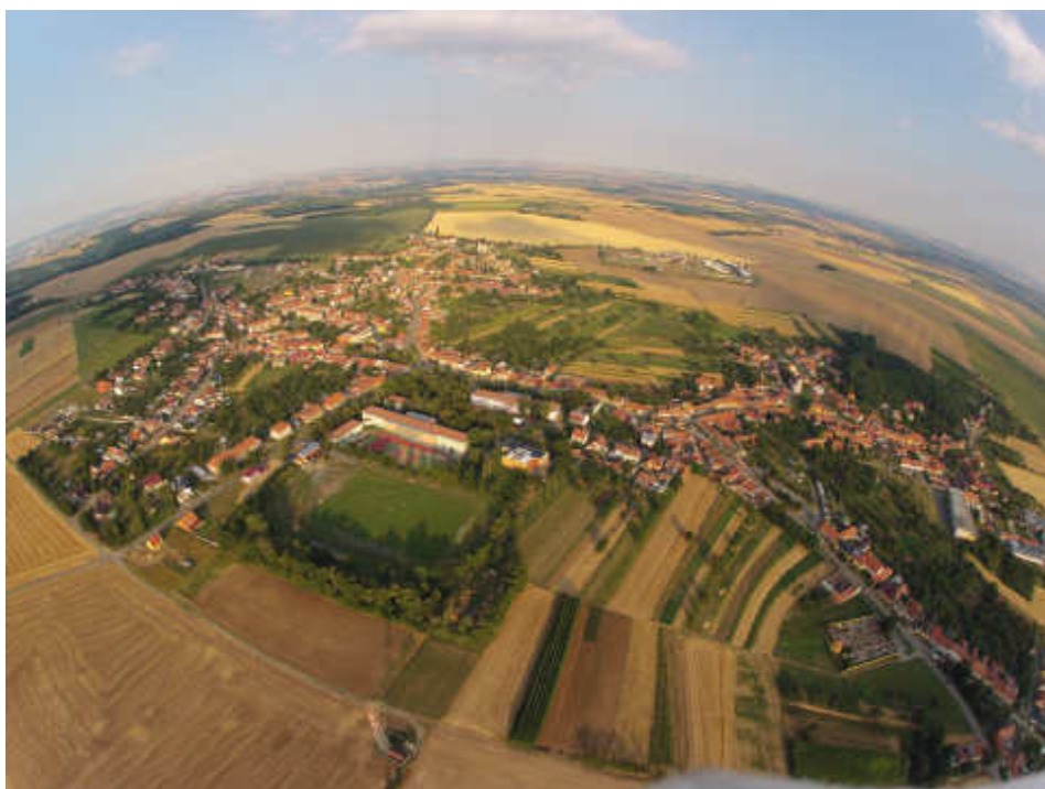
Pohled na Ořechov z kamery bezpilotního letadla