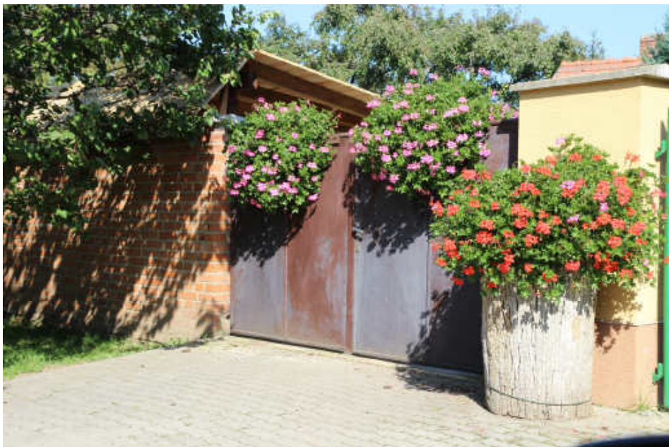
Dům na ulici Bakešova 26 - Kovářikovi