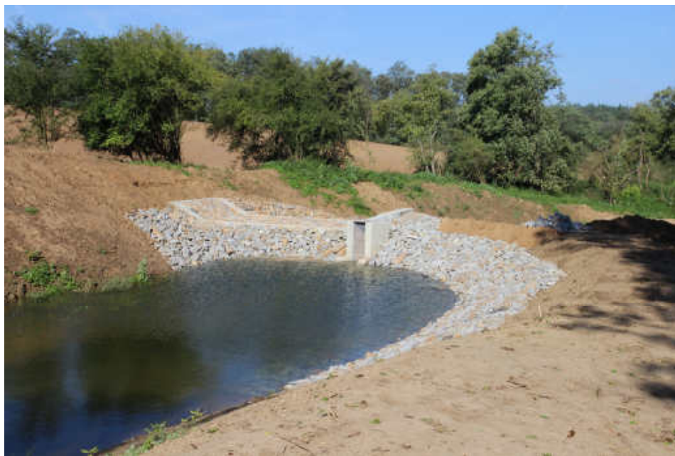
Napouštění rybníka s mokřadem nad Spáleným mlýnem